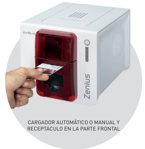
CARGADOR AUTOMÁTICO O MANUAL Y RECEPTÁCULO EN LA PARTE FRONTAL

Manipulación sencilla, reconocimiento y configuración automáticas de la cinta