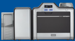
Impresora/codificadora de doble cara

HID Global introdujo la impresión de alta definición (HDP) en 1999 y hemos estado perfeccionando la tecnología desde entonces. La HDP5600 refleja nuestro compromiso a una innovación inspirada en los clientes y la evolución de nuestra familia de soluciones de Impresión de alta definición. Robustas y confiables, las impresoras/codificadoras de tarjeta HDP5600 de quinta generación de HID Global ofrecen la calidad de impresión con la que puede contar su organización y los avances tecnológicos que desea. Además, una confiabilidad de quinta generación significa mayor tranquilidad y menos tiempo muerto de impresión, y debido a que la cabeza de impresión nunca entra en contacto con las superficies de las tarjetas o desechos, nunca se daña en el proceso de impresión. De hecho, cuenta con una garantía vitalicia.