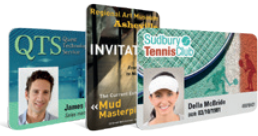
Cartoteca en línea